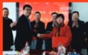
◎新校区建设签约仪式