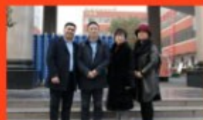
◎人大常委会到校指导工作