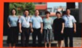
◎长沙市副市长肖征波到校指导工作