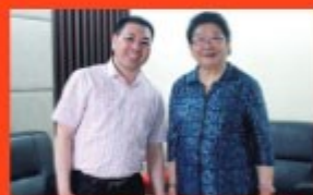
◎中国关心下一代工作委员会主任、第十届全国人大副委员长陈秀莲主任与英蓝教育集团胡应华董事长亲切合影。